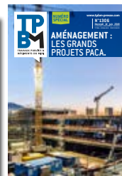
Aménagement : les grands projets Paca 23 juin 2021