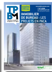
Immobilier de bureau : les projets en Paca 20 octobre 2021