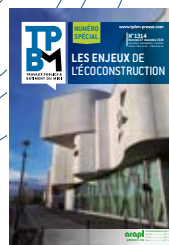
Les enjeux de l'écoconstruction 31 mars 2021